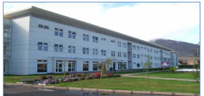
Establecimiento Penitenciario de La Serena