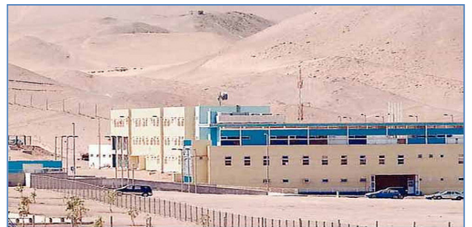
Establecimiento Penitenciario de Alto Hospicio