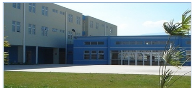
Establecimiento Penitenciario de Rancagua